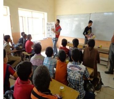
11 فرع النجف