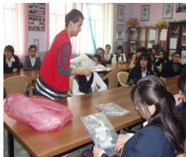
10 فرع السليمانية