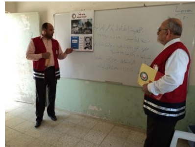
8 فرع ديالى