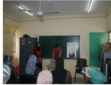
7 فرع ذي قار