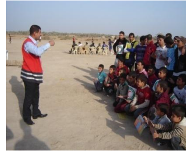
9 فرع بابل