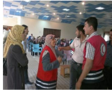
5 - فرع بغداد