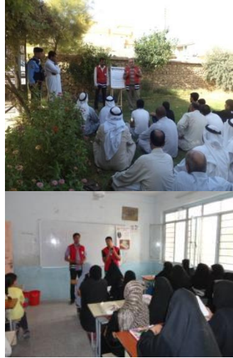
5- فرع النجف