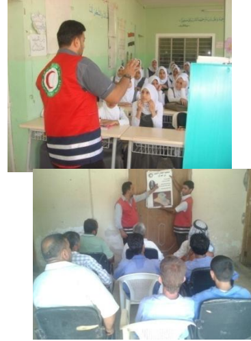
6- فرع كركوك