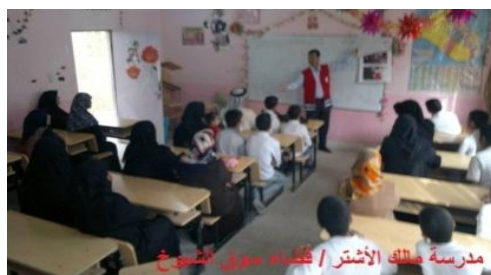
مدرسة مالك الأشتر / قضاء سوق الشيوخ