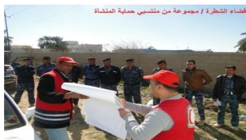
قضاء الشرطة / مجموعة من منتسبي حماية المنشأة